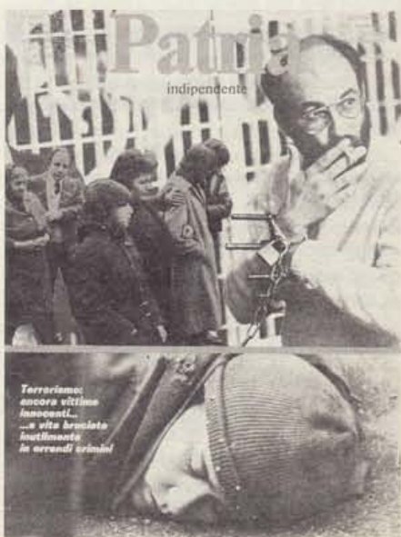
Terrorismo: ancora vittime innocenti... a vita bruciata inutilmente in orrendi crimini