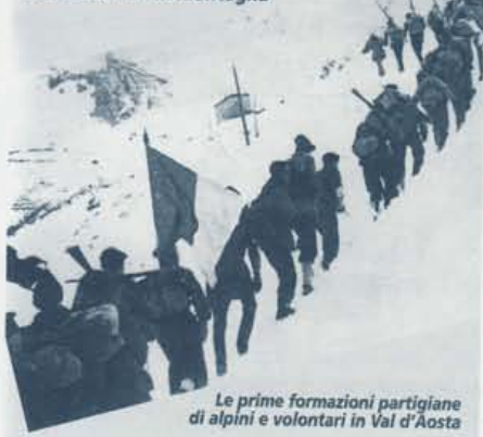
Le prime formazioni partigiane di alpini e volontari in Val d'Aosta

8 settembre 1943: il Tricolore va in montagna